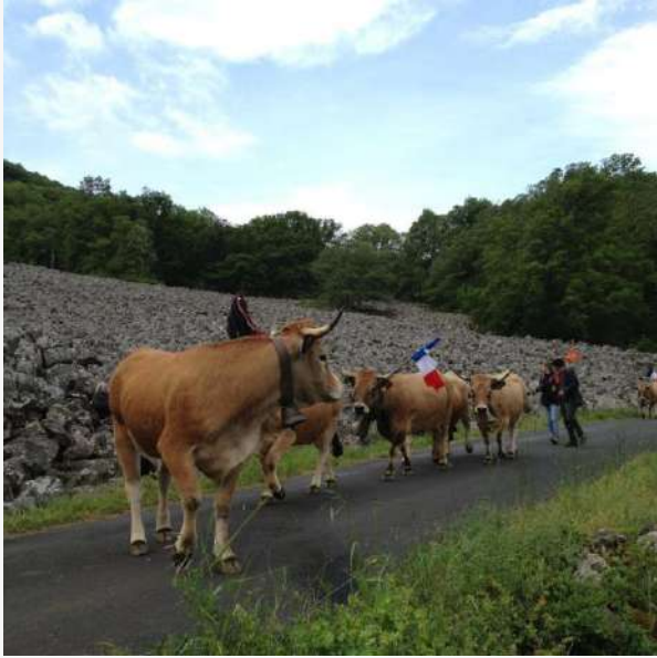
Transhumance 22 mai 2016 Coulée de lave de Roquelaure