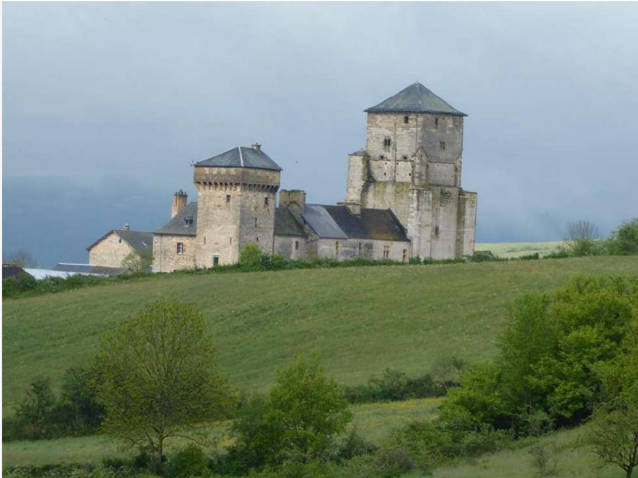
Galinières 14 mai 2016

Nous avons été chaleureusement accueillis à Galinières où s'est déroulée la journée du 14 mai 2016.