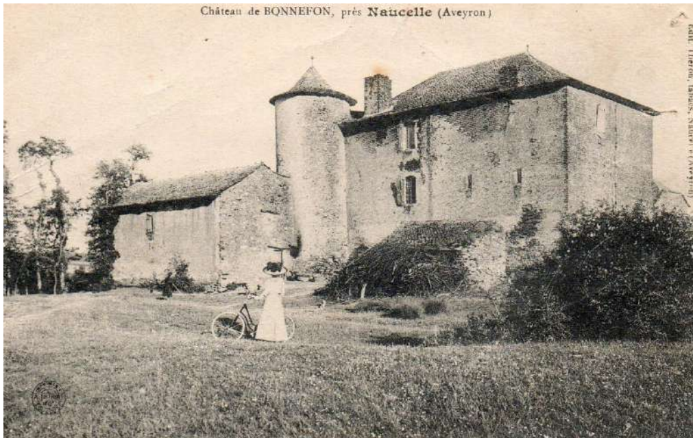
Carte postale de Bonnefon avant sa démolition en 1964

Nous étions 22 participants à la réunion organisée à la mairie de Naucelle autour de l'histoire cistercienne de Naucelle et en particulier de la grange de Bonnefon.