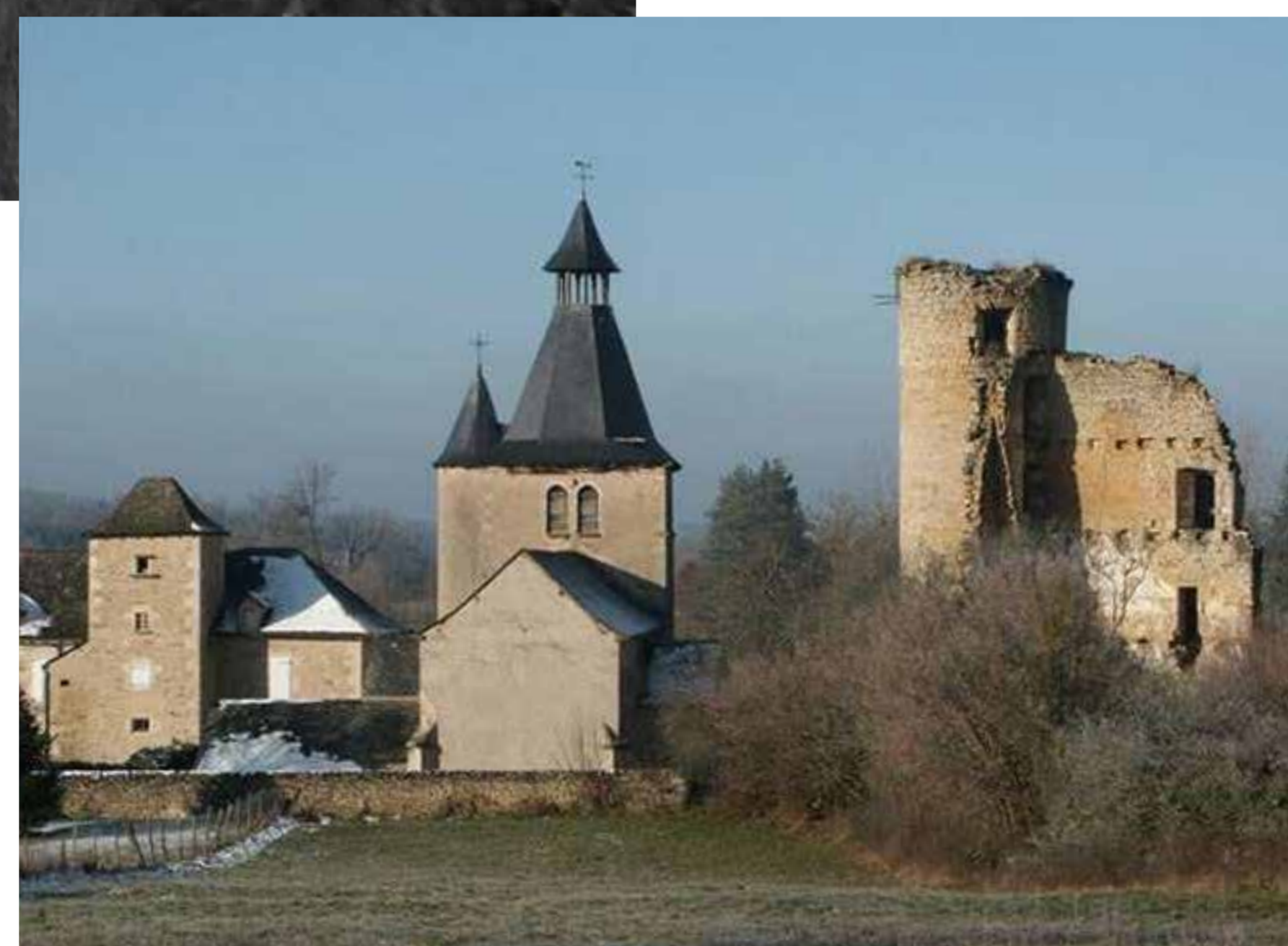
Vue arrière de gauche à droite : presbytère, église, château. On observera que depuis 1970 il n'y a pas eu d'altération du bâti. CeR.