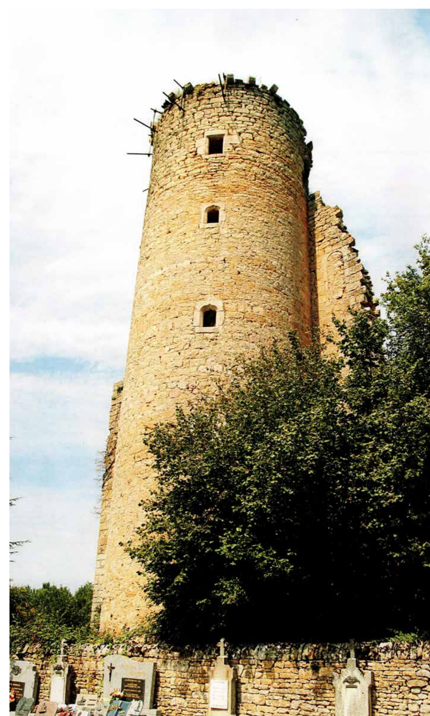
Archives UDAP 12.

À partir de 1683, Fontaynous devient la résidence de l'abbé commendataire de Loc-Dieu. Par le passé, la tour abritait un escalier.