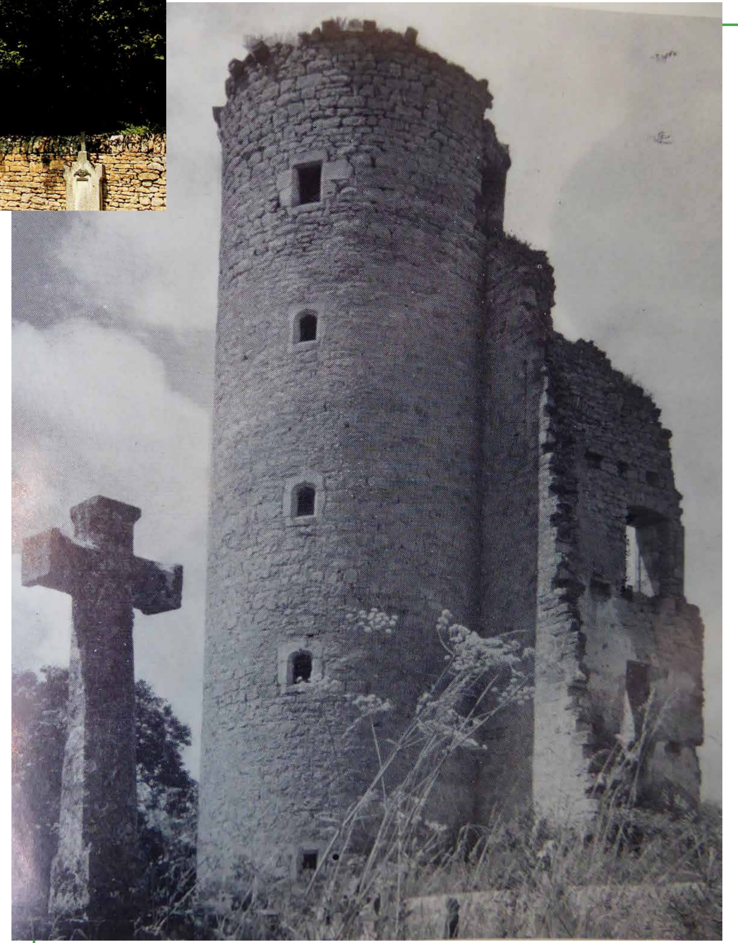
Vue du cimetière. La tour abritait la vaste cage d'escalier du château. « Ombres et lumières en Bas Rouergue », Vignerot (R.) éd. Salingrades.